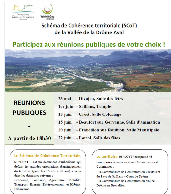
Affiche de communication – Affichée dans toutes les communes