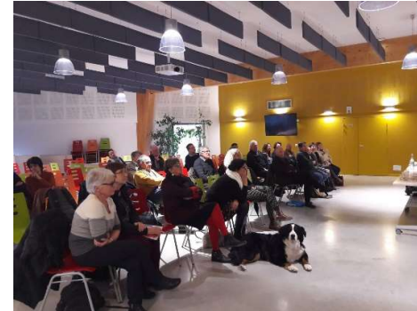
Commission thématique – 7 février 2019 – Biovallée le Campus (Eure)

La phase de PADD débute début 2019. Une commission thématique est organisée le 7 février 2019 à destination de l'ensemble des élus du territoire.