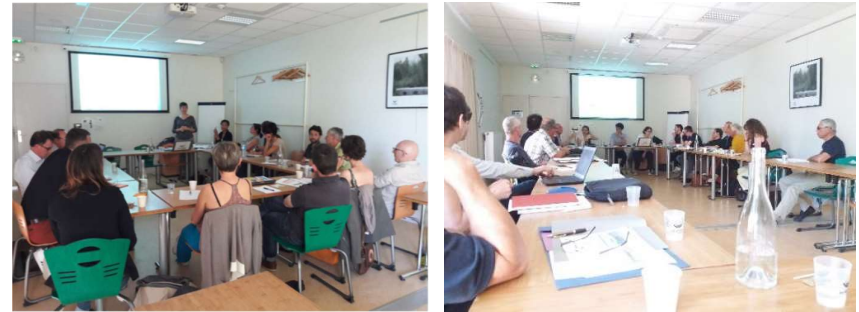
Atelier « Environnement » et « Economie » - 23 et 24 avril 2018 – Biovallée le Campus

En totalité, 43 acteurs du territoire ont participé à ces ateliers.