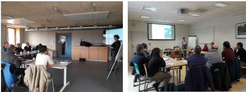
Atelier du territoire, travail en groupe et plénière du 7 février 2019

Ces ateliers ont réuni une trentaine de participants.