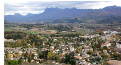
Le SCoT, schéma de cohésion territoriale qui réunit les deux communautés de communes du Crestois et du pays de Saillans, et du Val de Drôme en Biovallée, soit 44 communes et 46 305 habitants, a été présenté jeudi 29 novembre à Eurre.

Six ans de travail résumé en un peu plus de deux heures. C'était le challenge de la présentation du SCoT (schéma de cohésion territoriale) de la vallée de la Drôme qui a eu lieu jeudi 29 novembre à l'écosite d'Eurre, devant près de 100 personnes.