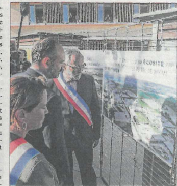
Édouard Philippe, premier ministre, était récemment au campus de la Biovallée à Eure, où se déroulera la réunion publique du 2 octobre.

PADD qui constitue le projet politique dans lequel les élus exposent leur vision de l'avenir sur le plan de l'aménagement du territoire. De très nombreux domaines sont concernés : habitat, déplacements, cadre de vie, environnement, économie, équipements, emploi, tourisme... Le PADD devrait être validé en décembre 2019. Parallèlement, le travail d'élaboration du Document d'Orientation et d'Objectifs (DOO) qui constitue la 3 e phase d'élaboration du SCoT, débutera à l'automne 2019. Le SCoT devrait être applicable en 2021. Le PADD est téléchargeable sur le site internet du SCoT (www.scot-valleedrome.fr) dans la rubrique « Téléchargement » puis « PADD ».