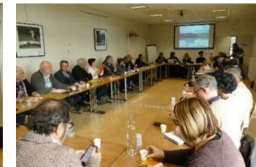
Commissions thématiques - salle trois becs (Campus Biovallée)