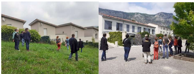
Sur le terrain à la découverte des logements de La Roche-sur-Grane et Saoû