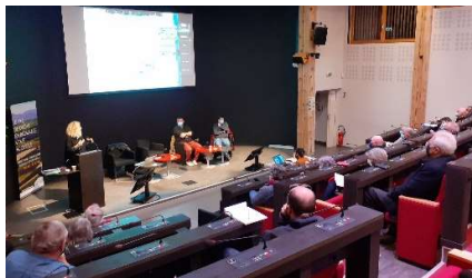
Réunion Plénière – 1 décembre 2021

À cause des conditions sanitaires en vigueur, nous avons été contraints de limiter le nombre de présents et avons organisé une visioconférence en parallèle. Environ 40 personnes ont participé en présentiel à cette réunion.