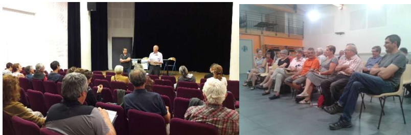
Réunion publique à Saillans et Beaufort-sur-Gervanne