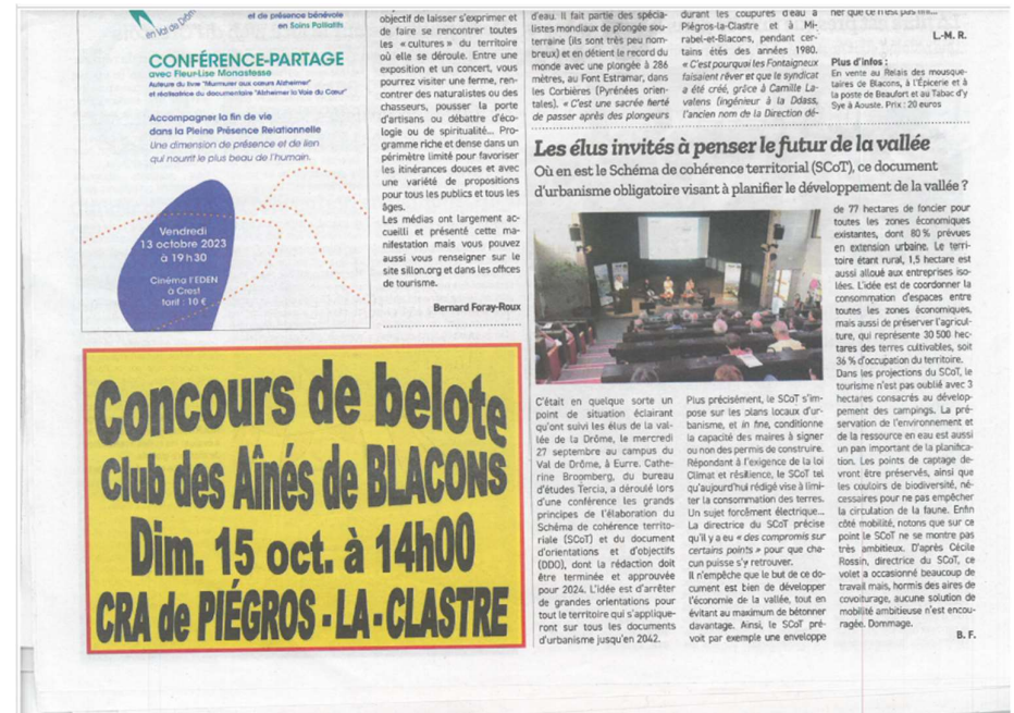
Article du Crestois du Vendredi 13 Octobre 2023

Une troisième plénière a également été organisée pour présenter le projet SCoT et des principaux éléments du Document d'Orientations et d'Objectifs le 27 septembre 2023. Elle a réuni environ 40 personnes dans l'amphithéâtre.