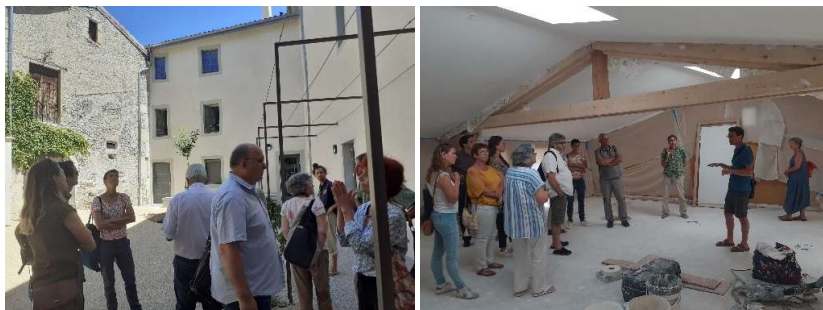
Visite du tiers lieu l'Avant-Poste et de la résidence Blagnac à Die