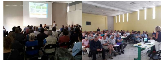
Plénière des élus du territoire – 8 juin 2018 -Salle AMAPE (Crest)

Cette réunion a suscité l'intérêt des 60 élus présents, les échanges et retours ont été riches.