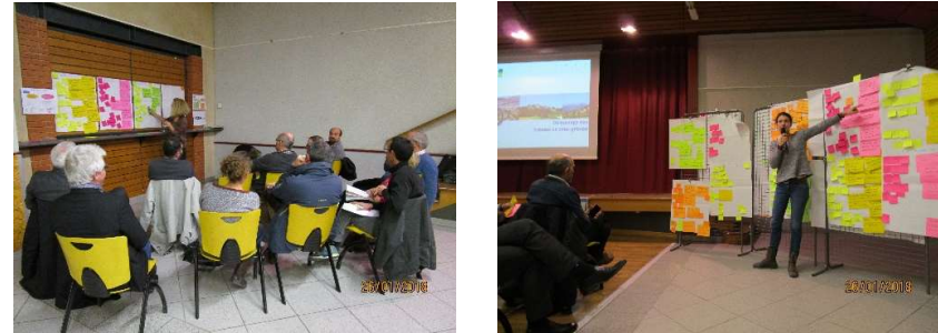
Echange en sous-groupes et restitution

Afin de pouvoir finaliser le diagnostic et les analyses thématiques, il est nécessaire de caractériser l'armature territoriale sur laquelle repose le fonctionnement et l'organisation du territoire aujourd'hui. Le souhait des élus du syndicat mixte du SCoT est que cette vision soit largement partagée par l'ensemble des élus du territoire du SCoT avant de poursuivre par les enjeux pour l'avenir.