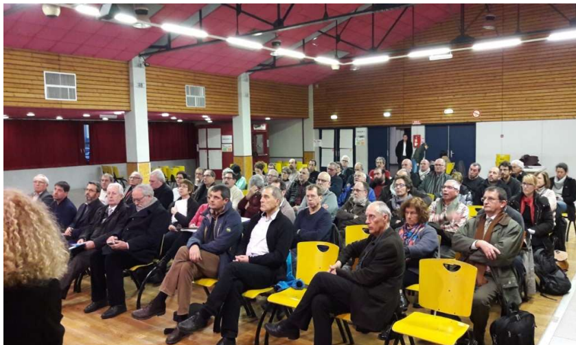
Réunion plénière – 24 janvier 2018 - Salle coloriage (Crest)