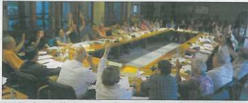
Avec 24 voix pour, déménagement et financement ont reçu un avis favorable

Conseil express pour les élus de la CCCPS en ce 19 mai. Il s'agissait, comme nous l'avons écrit la semaine passée, de voter le nouveau emplacement du centre aquatique et de valider le plan de financement. Et c'est avec 24 voix "pour" et 15 "contre" que tout ceci a été décidé non sans que quelques élus ne donnent leur façon de voir les choses au président et aux vice-présidents.