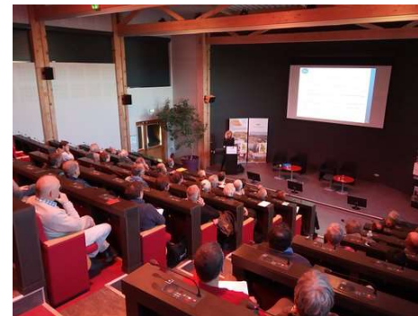
Réunion Plénière du 4 avril 2019

L'assemblée a aussi souligné la forte attractivité du territoire et le déficit d'emploi à combler afin d'offrir aux nouveaux arrivants un emploi (« déficit actuel de 6000 emplois sur le territoire »). La problématique des déplacements pour se rendre sur son lieu de travail est également évoquée ainsi que le lien entre la logistique et la mobilité.